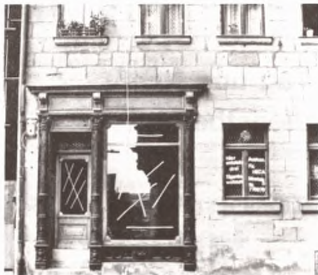
Gustavstraße 11: bald Pilsbar und Spielhalle

Zwar begrüßt die Bürgervereinigung den im Stadtratplenium zu erwartenden Beschluß dieses Bebauungsplans 001 (007 klänge noch abenteuerlicher!). Was bleibt ihr auch viel anderes übrig? Und dennoch kann man heute bereits ohne allzuviel Prophetie sagen, daß er zu spät