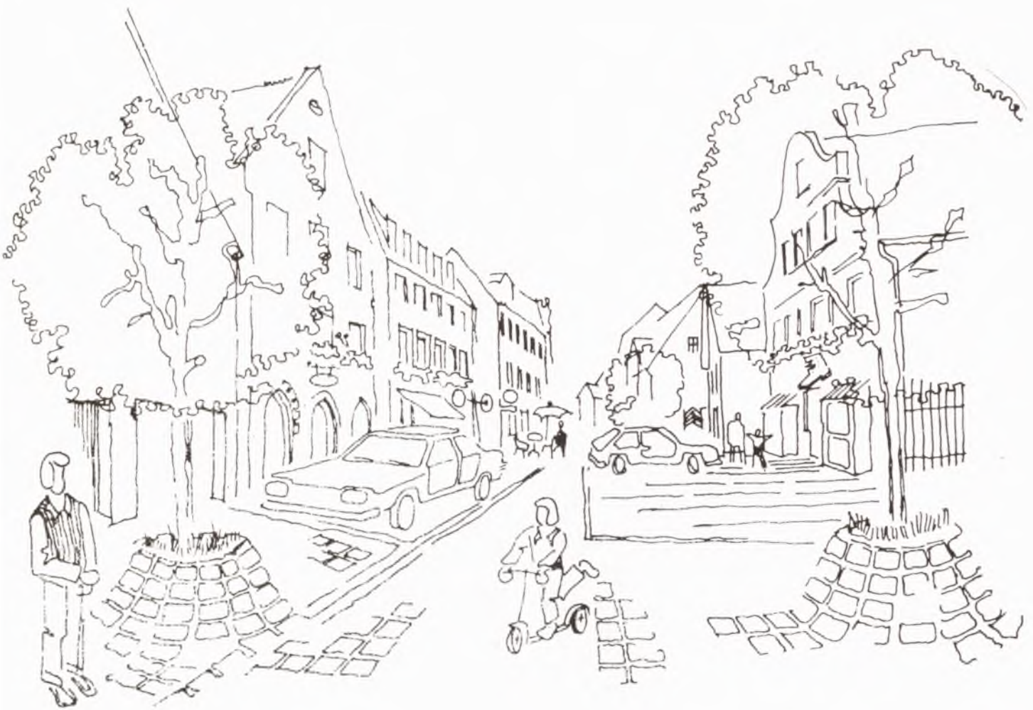
Die Gustavstraße nach der Verkehrsberuhigung (Zeichnung: Manfred Jupitz)