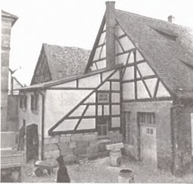
Der »Schuppen« kurz vor Abschluß der Renovierungsarbeiten

Dank »fleißiger Hände« in den vergangenen Monaten konnte sogar an die Westfront der Städtischen Freibank »Hand angelegt« und das dort vorhandene Fachwerk freigelegt werden. Daß diese sogenannten fleißigen Hände nur einigen wenigen aktiven Mitgliedern und Mitarbeitern gehörten und immer dieselben waren, sei keineswegs ver-