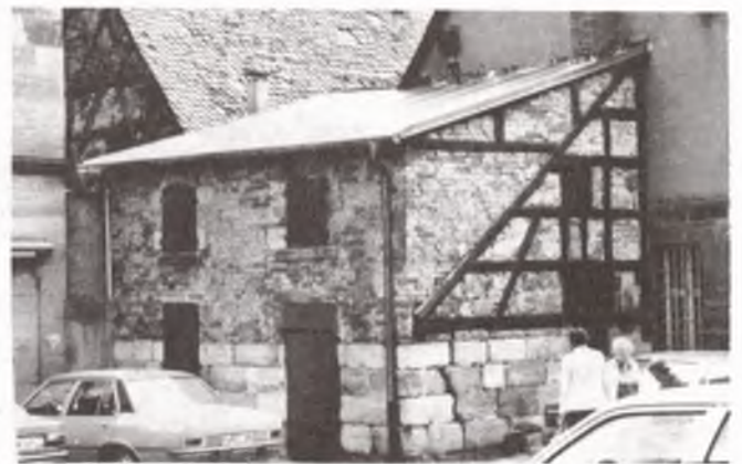
Der Schuppen der Bürgervereinigung während der Renovierung

Gerade zur Jahreswende und den nach schöner Tradition (oder leerer Konvention?) damit verbundenen guten Vorsätzen ist die Möglichkeit gegeben, sich über das Verhältnis Amateur- bzw. Berufsbürger gegenüber den Berufs- (oder Amateur-?)Politikern einige tiefgründige Gedanken zu machen und daraus die emanzipatorischen Konsequenzen zu ziehen. Etwa nach dem Motto: »Was man nicht selbst anpackt und anderen überläßt, das wird nichts« oder so ähnlich. Eine Erkenntnis, die in der Bürgervereinigung seit Jahren zur alltäglichen traurigen Erfahrung geworden ist.