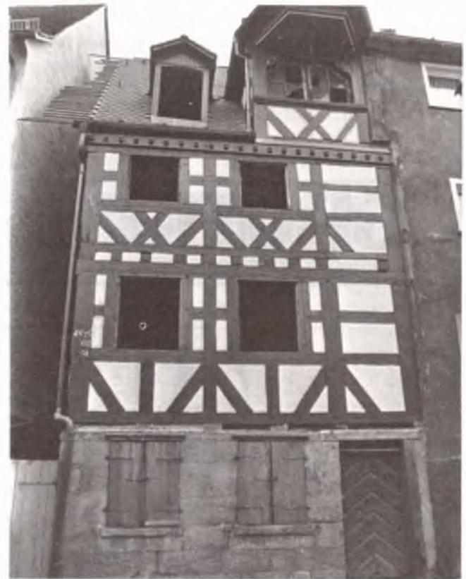
Untere Fischerstraße 9

Ein städtisches Anwesen gleicher Güte oder gar im Zustand aktueller Renovierung bzw. Sanierung konnte im St. Michaels-Viertel nicht ausfindig gemacht werden.