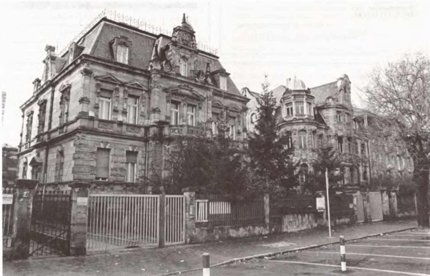
Die beiden Historismus-Villen an der Königswarterstraße bleiben Fürth erhalten

nungen genutztes Backsteinhinterhaus befinden, sollen - ähnlich wie beim »Dürerhof« unterhalb der Nürnberger Burg - künftig Tiefgaragen, Wohneinheiten und eine Passage möglichst bis zum Bahnhofplatz eine innerstädtische Bereicherung darstellen - jedenfalls nach den Vorstellungen der neuen Eigentümer. Problem dabei: das Gastreich-Grundstück am Bahnhofplatz (wo heute Fahrzeuge der Bundespost parken) steht, zumindest vorerst, nicht zum Verkauf. Möglicherweise scheitert eine im Prin-