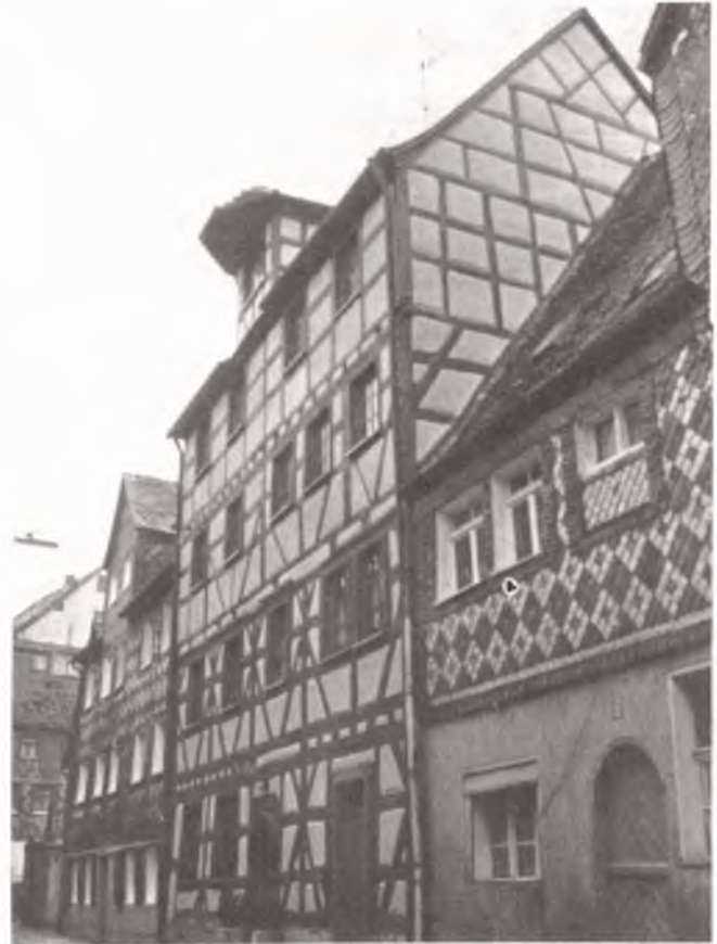
Schindelgasse 13; Nr. 15, rechts: ebenfalls städtisch, aber wenigstens noch bewohnbar

Im (zugegeben: bewußten) Gegensatz dazu zwei private Gebäude, bereits renoviert (Schindelgasse 13) oder derzeit im aufwendigen Umbau (Untere Fischerstraße 9):