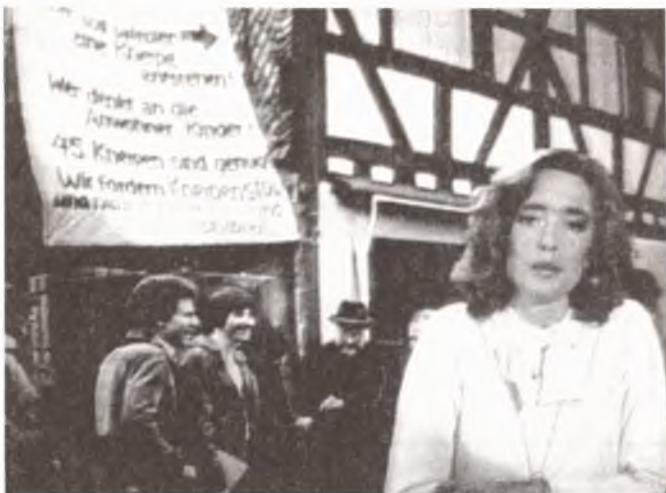
Die Fernsehsendung des Bayerischen Rundfunks von 1981 über die »Aktion Kneipenstop«; im Hintergrund die Unterschriftensammlung der Bürgervereinigung von 1980

Die lange Zeit hinausgezögerte und vor kurzem doch erfolgte Genehmigung eines Lokals in der Waagstraße 2 (siehe Altstadt-Bläddla 13/82, S. 2, »Trauerspiel wird zur Tragödie«!) hat nun das Faß endgültig zum Überlaufen gebracht. Die Bürgervereinigung, als Eigentümer des unmittelbar benachbarten »Schuppens« am Waagplatz selbst